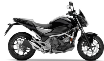
Matt Gunpowder Black Metallic