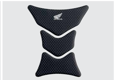
TANKVÉDŐ (HONDA WING LOGÓ) 08P61-MEJ-800

Karbonszál hatású, öntapadó hátoldali tankvédő HRC logóval. Segítségével megóvhatja a tank fényezését a karcolásoktól és kidörzsölődéstől.