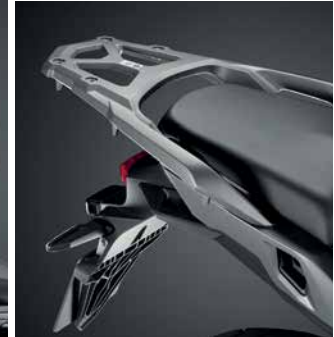
HÁTSÓ DOBOZ TARTÓKONZOL O8L71-MJM-D10

Fekete színű belső táska, amely tökéletesen illeszkedik a 31 l-es dobozba. Körülbelül 20 liter kapacitású, gyorsan és egyszerűen kivethető. Fekete cipzárral és fekete Honda szárny logóval, ill. állítható vállpánttal és fogantyúval.