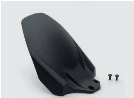
HÁTSÓ SÁRVÉDŐ 08F70-MJM-D10

Megvédi a lengéscsillapítót a hátsó kerékről felverődő szennyeződésektől és úlszórótól.