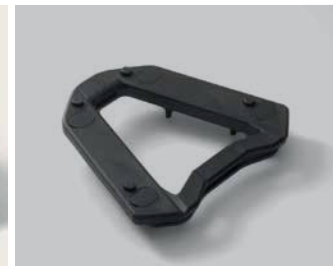
HÁTSÓ DOBOZ TARTÓKONZOL SZETT

Világosszürke táska fekete cipzárral és fekete Honda szárny logóval az első zseben. 21-ről 33 l-re nyitható, az első zsebben egy A4 méretű mappa is elfér. Állítható vállpánttal és fogantyúval.