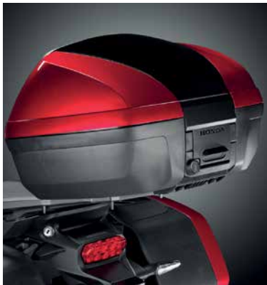
45 LITERES HÁTSÓ DOBOZ SZETT

Bármely 31/45 literes hátsó doboz felszereléséhez szükséges.