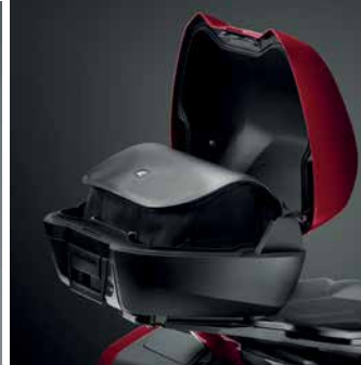
HÁTSÓ DOBOZ BELSŐ TÁSKA O8L56-MGE-800A

Kiegészítő utasülés-háttámla, amely a hátsó doboz fedelére van rögzítve.