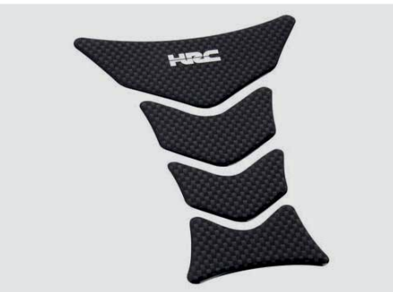
TANKVÉDŐ (HRC LOGÓ) 08P61-KAZ-800B

Megvédi a lengéscsillapítót a hátsó kerékről felverődő szennyeződésektől és úlszórótól.