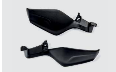
KÉZVÉDŐ SZETT 08P70-MJM-D40

15 mm-es alumínium távtartó (módosítja a kormányzár helyzetét az emelt testtartású motorozáshoz).