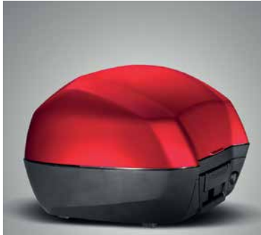
31 LITERES HÁTSÓ DOBOZ O8ESY-MJM-TB31ZA, B VAGY H

31 literes hátsó doboz, melybe 1 zárt sisakon túl sok más is belefér. Gyorscsatlakozós rögzítőrendszerrel rendelkezik, mely a motorkerékpár kulcsával működtethető. A dupla zsanérok és az integrált tömítés a tervezés új szintjét nyújtják. 3 színben kapható: - Victory Red (TB31ZA) - Darkness Black Metallic (TB31ZB) - Digital Silver Metallic (TB31ZH) Ez a szett tartalmazza az egykulcsos rendszert, a hátsó tartót és a rögzítőkeretet.