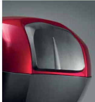
HÁTTÁMLA 31 LITERES HÁTSÓ DOBOZHOZ

31 literes hátsó doboz, melybe 1 zárt sisakon túl sok más is belefér. Gyorscsatlakozós rögzítőrendszerrel rendelkezik, mely a motorkerékpár kulcsával működtethető. A dupla zsanérok és az integrált tömítés a tervezés új szintjét nyújtják. 3 színben kapható: - Victory Red (TB31ZA) - Darkness Black Metallic (TB31ZB) - Digital Silver Metallic (TB31ZH) Ez a szett tartalmazza az egykulcsos rendszert, a hátsó tartót és a rögzítőkeretet.