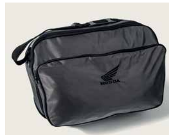
DELUXE HÁTSÓ DOBOZ BELSŐ TÁSKA (45 L)

45 literes hátsó doboz, melybe 2 zárt sisakon túl sok más is belefér. Gyorscsatlakozós rögzítőrendszerrel rendelkezik, mely a motorkerékpár kulcsával működtethető, valamint egy háttámlával. 3 színben kapható: - Victory Red (TB45ZF) - Darkness Black Metallic (TB45ZC) - Digital Silver Metallic (TB45ZS) Ez a szett tartalmazza az egykulcsos rendszert, a hátsó tartót és a rögzítőkeretet.