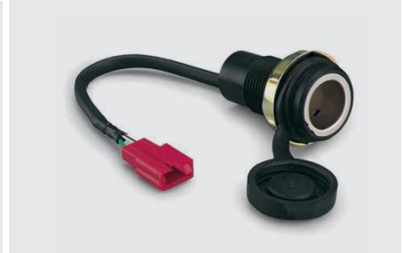
12 V CSATLAKOZÓ 08U70-MJM-D00

Két kézvédő az eső és szél elleni még nagyobb védelem érdekében.